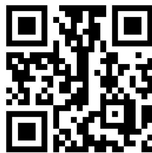
エントリー用QRコード