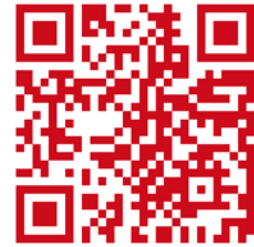
エントリー用QRコード

上記のサイト又は、QRコードからアクセスし、 出演枠をご購入頂いてエントリー確定となります。